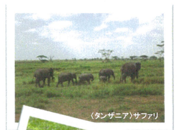
〈タンザニア〉サファリ

定 員 : 50名 受講者人数を会場定員の1/3以下にし、十分な間隔を確保いたします