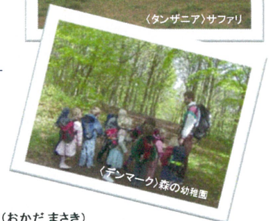
〈デンマーク〉森の幼稚園